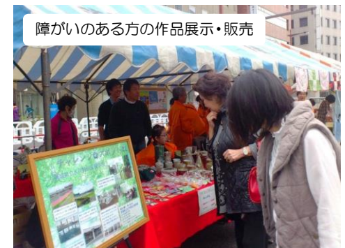
障がいのある方の作品展示・販売

水戸はバリアフリー化があまり進んでいないと言われます。障がいなどで移動が大変な人でも、気軽にまちなかで買い物をするには、市民の助けあいが必要です。