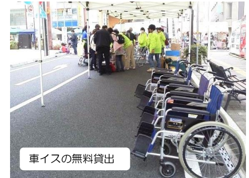
車イスの無料貸出