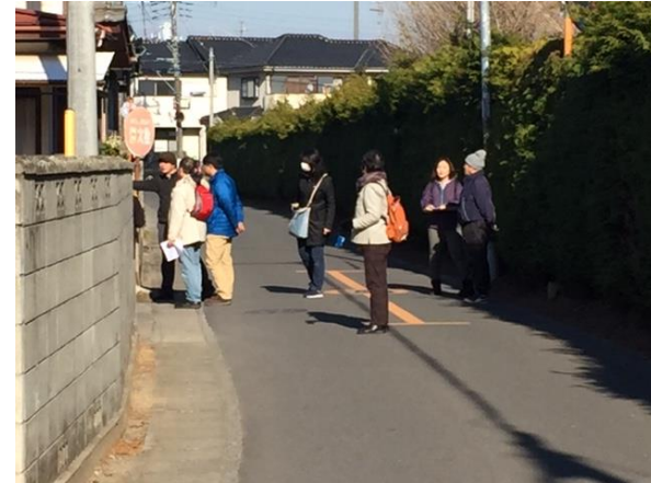
グループで危険箇所を確認