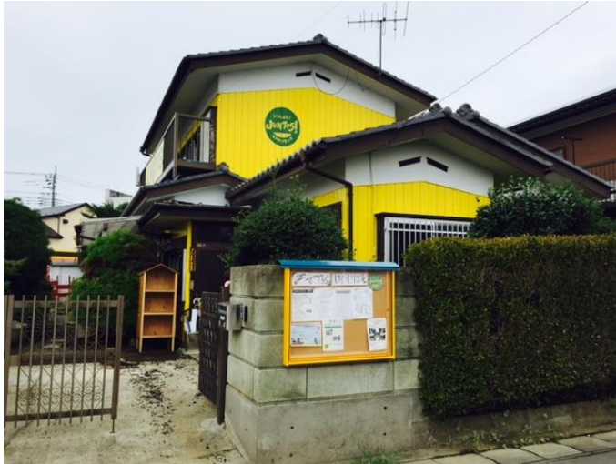
再生からもうすぐ1年