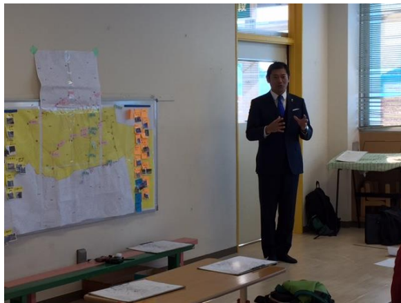
市長「自主防災のモデルに！」