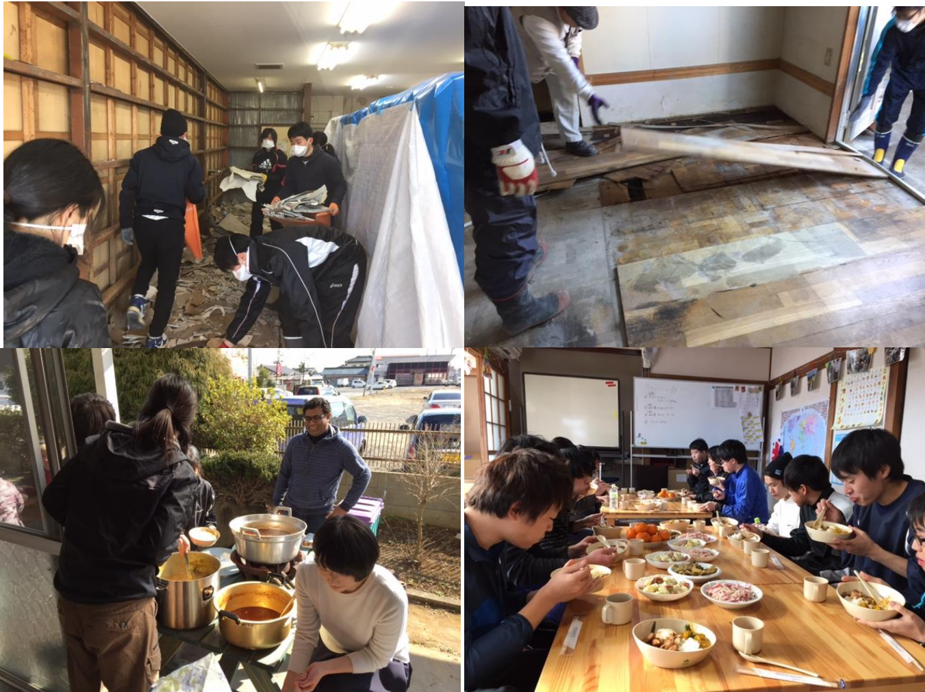
ランチは特製スリランカカレー