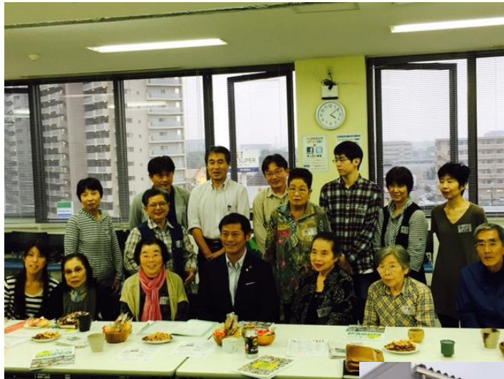
茶話会に市長も出席