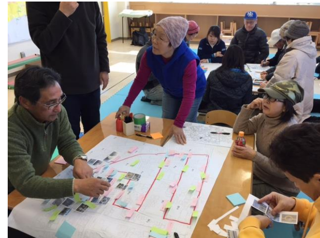
気づいたことを地図に