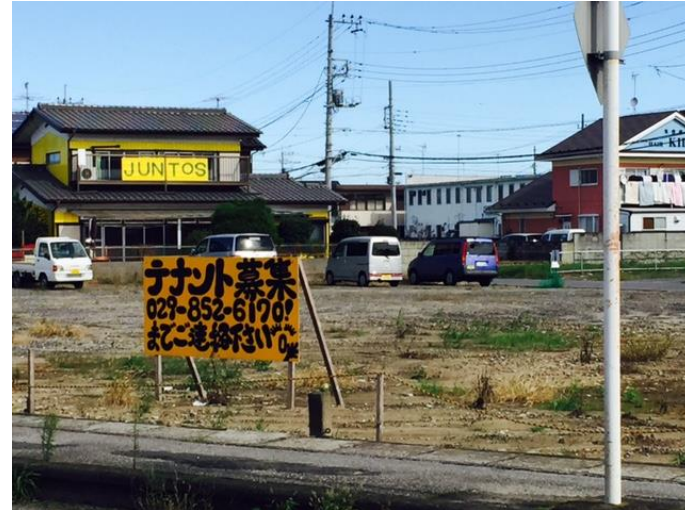
レストラン跡地は空き地のまま