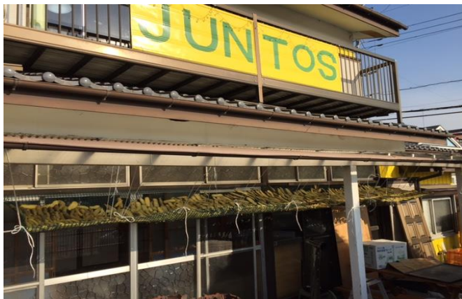
自家製干しいものは大好評