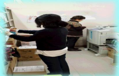
就労体験の印刷作業をしています