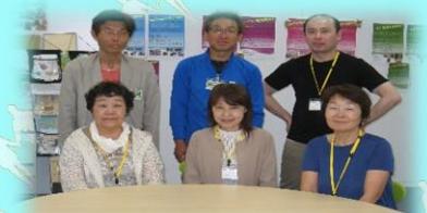
私たちがお手伝いします