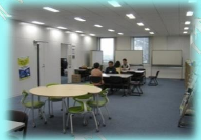
広い空間があなたをお待ちしています

毎週 水曜日 相談日 開所 9:00～17:00 相談 受付時間 9:30～16:00 毎週 金曜日 就労体験などの活動日です 予約は平日9:00～17:00お電話をお受けします