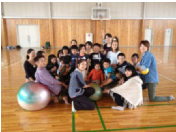
写真：Gボールを真ん中に集め、子どもたちはその上に乗っちゃいました♪

「Gボール」を使って親子で遊んだり、キッズだけでフリーマーケットでお買い物を楽しんだりしました。