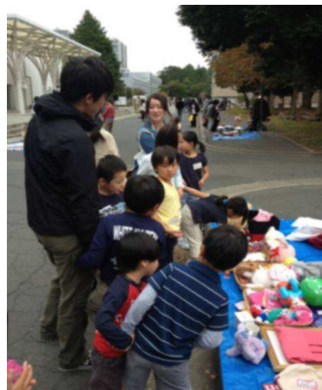
写真：茨城大学で開かれたフリーマーケットを楽しみむ子どもたち