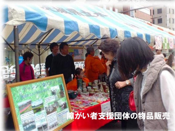
障がい者支援団体の物品販売

水戸のまちなかは、他の街と比べて、バリアフリー化があまり進んでいないと言われています。障がいがあるなど移動が大変な人でも、気軽にまちなかで買い物をするには、施設や公共交通のバリアフリー化とともに、市民の助けあいも必要です。