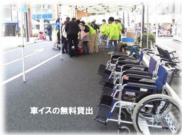
車イスの無料貸出