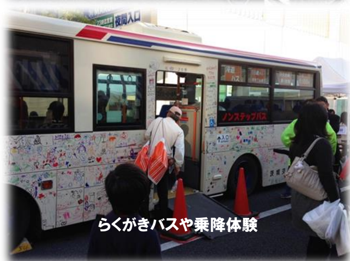
らくがきバスや乗降体験