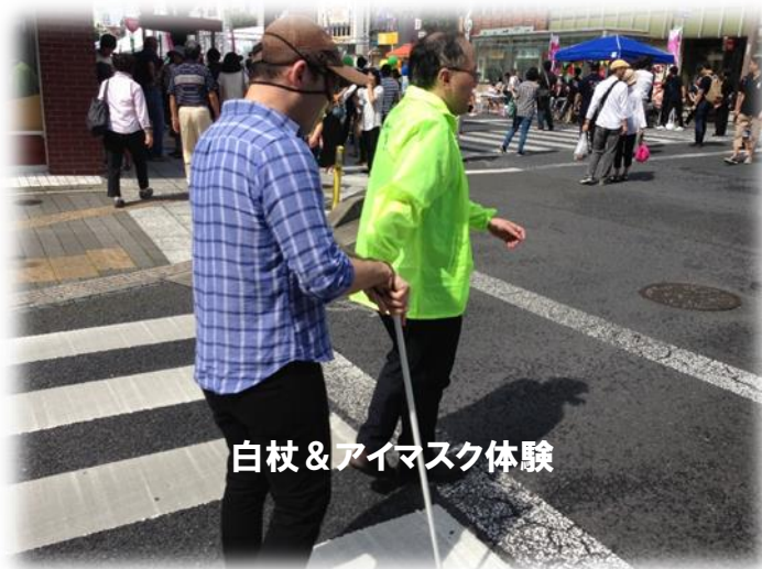
白杖 & アイマスク体験