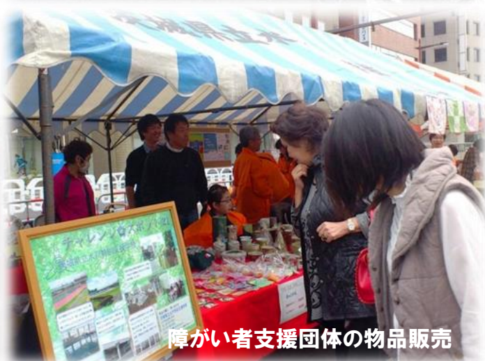
障がい者支援団体の物品販売

水戸のまちなかは、他の街と比べて、バリアフリー化があまり進んでいないと言われています。障がいがあるなど移動が大変な人でも、気軽にまちなかで買い物をするには、施設や公共交通のバリアフリー化とともに、市民の助けあいも必要です。