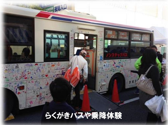
らくがきバスや乗降体験