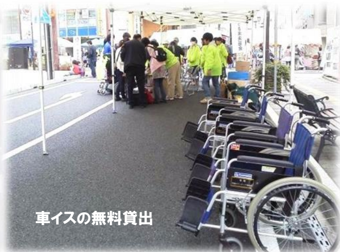
車イスの無料貸出