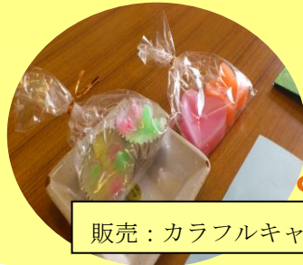
販売：カラフルキャンドル、お皿など焼き物

会場(中央郵便局⇄大工町交差点)までは、千波湖護国神社、青柳公設市場より出ているシャトルバスをご利用ください。(右下参照)