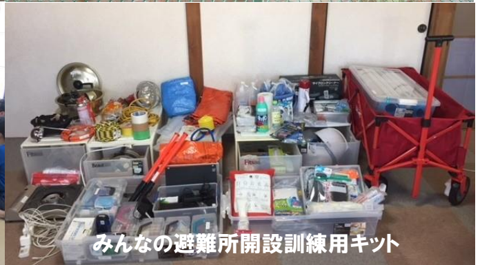
みんなの避難所開設訓練用キット

3年前、茨城県常総市を襲った鬼怒川の堤防決壊による洪水の際、避難指示が出て、どこに逃げれば良いかわからない人は自宅にとどまり、夜間に浸水で身動きが取れなくなり、翌日に1,000名以上が自衛隊のヘリで救助されました。