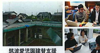
筑波愛児園建替支援

「誰もが金融サービスにアクセスできる世界」を実現するため、途上国のマイクロファイナンス機関を支援しています。