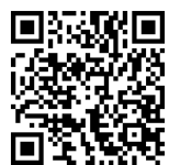
えんがわハウスの情報