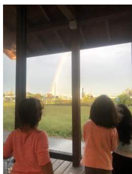
窓から常総線、たまには虹がみえます。