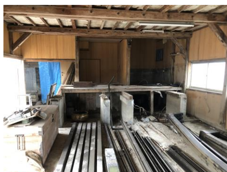
改修前は工場跡地