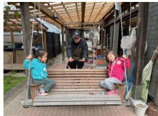
保育園の中、外で一緒に遊びました。