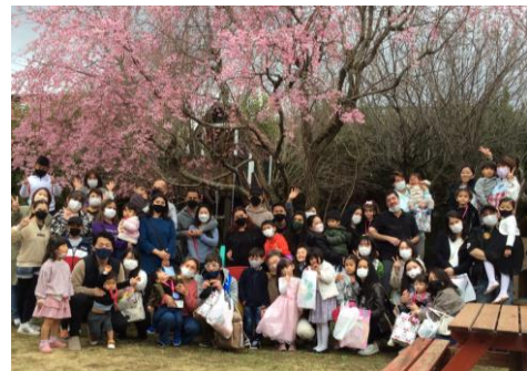
保育を通して、助け合える仲間づくりを広げていきます。

3千万円を超える借入を返済し、空き家活用型地域づくりの実験を成功させ、公的支援がない外国ルーツの人の生活や学習を支えるために寄付を募集しています。