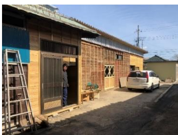
店舗兼住宅の奥の工場建屋を多目的棟に改修。ウクライナの絵本から「てぶくろの部屋」としました。