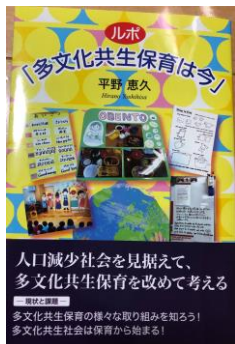
この本に、はじめのいっぽ保育園の事例が掲載されました。