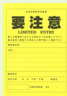
黄色的纸 (需要注意)