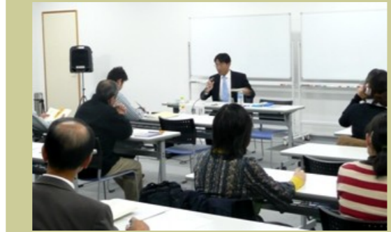
▲11/10会計支援勉強会。わかりやすいと好評でした。