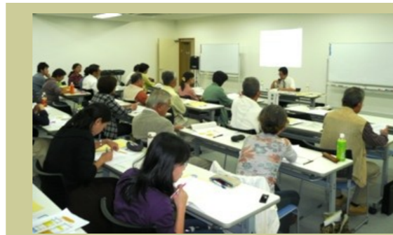
▲10/6会計基準学習会。20名が熱心に耳を傾けました。