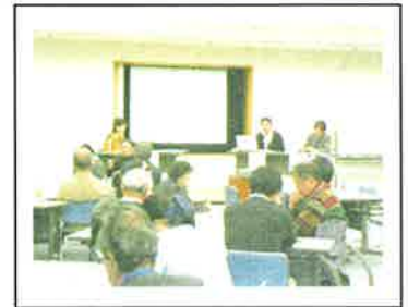
コモンズ 10 周年式典