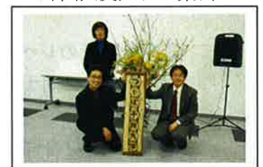
つくば市民大学が開校