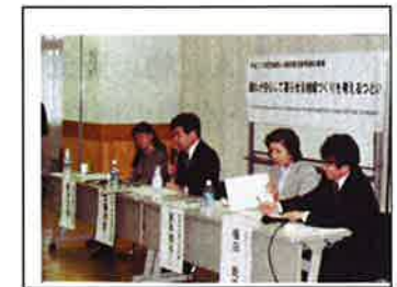
外国人受入れで集会